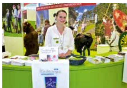
Ostalb-Werbung auf der CMT in Stuttgart.

Die Ostalb gerade jetzt zum Ziel von Ausflügen zu machen, gibt