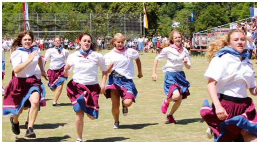
Der Schäferlauf in Bad Urach wird seit 300 Jahren veranstaltet.

Historische Dampfzugfahrten mit Lok und Wagen aus den 1920er-Jahren über die offene Schwäbische Ostalb gibt es u.a. am 12. August. Der Zug befährt zeitweise einen Steigungsabschnitt wie die Geislinger Steige. Die 1906 eröffnete ehemalige Bahnstrecke Amstetten-Gerstetten befindet sich seit 1998 im Eigentum des Vereins UEF Lokalbahn Amstetten-Gerstetten und wird seit 1976 von historischen Dampfzügen der Ulmer Eisenbahnfreunde befahren. Zwischen Amstetten und Gerstetten verkehrt bis zum zweiten Sonntag im Oktober an allen Sonn- und Feiertagen ein Touristikzug der Schwäbischen Alb-Bahn SAB, außer an den Tagen, an denen der Dampfzug unterwegs ist. www.uef-lokalbahn.de