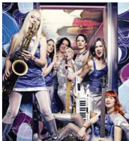
»Die Gabys« kommen.

wird dieses altschwäbische Heimatfest ab 11 Uhr von einem farbenprächtigen Festzug, der von rund 2100 Teilnehmern in Blaskapellen, Trachtengruppen und auf Festwagen gebildet wird. Der Uracher Festzug ist einer der wenigen im Land, der vollständig ohne motorisierte Fahrzeuge auskommt. Die Gespanne werden komplett von Pferden, Ziegen oder Ochsen gezogen. Als weiterer Höhepunkt steht bereits am 22. Juli das Leistungshüten des Landesschafzuchtverbandes auf dem Programm. www.badurach-schaeferlauf.de