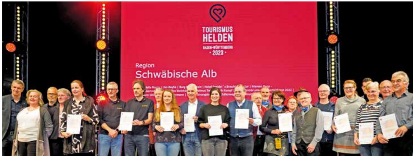
Die Tourismus-Helden von der Schwäbischen Alb wurden bei der Reisemesse CMT in Stuttgart ausgezeichnet.