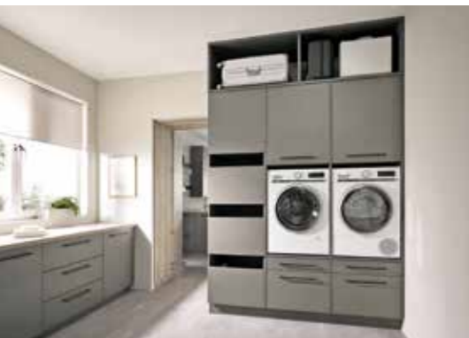
Stauraumlösungen für den Wirtschaftsraum ermöglichen die Erledigung der Hausarbeiten.