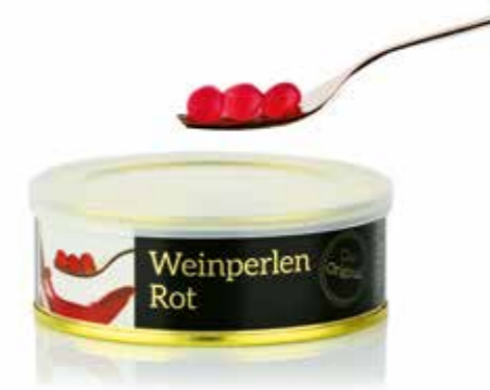
Weinperlen in Dosen eignen sich als Präsent.

»Die Perlen werden auch gerne verschenkt. Dafür haben wir die Dosen mit einem erklärenden Flyer einzeln