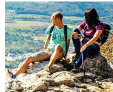
Herrliche Blicke auf die Täler und Berge der Alb.

Beim Wandern sich als Prinz oder Prinzessin fühlen? Die Tour auf dem zertifizierten Premiumweg »Hochgehträumt« macht es möglich, denn sie beginnt auf dem Parkplatz am Märchenschloss Lichtenstein (alternativ ab den kostenfreien Parkplätzen drumherum). Vor der majestätischen Kulisse geht die knapp elf Kilometer lange Tour, die sich in gut dreieinhalb Stunden bewältigen lässt, durch verwunschene Wälder. Herrliche Ausblicke auf die Alb-Landschaft bieten der Brunnenstein, der felsige Breitenstein mit Blick auf das Schloss Lichtenstein oder der Gießstein mit Blick bis zum Feldberg oder auf das Echaztal. Der Weg, der in einer Höhe von 750 und 836 Metern verläuft, führt auch vorbei an der Ruine Lichtenstein, dem einstigen Sitz der Herren von Lichtenstein. Auch kulinarisch kann sich der Weg »hochgehträumt« sehen lassen. Zum Beispiel mit dem alten, 1840 erbauten, Forsthaus mit ländlicher Küche oder dem Forellenhof Rössle in Honau. Grillstellen unterwegs laden Selbstversorger ein. Wer einen kleinen Adrenalinkick verträgt, ist im Lichtensteiner Abenteuerpark in den Höhen der Baumwipfel richtig oder wirft nach der Tour noch einen Blick in die nahegelegene Nebelhöhle. Und wer Schloss Lichtenstein noch nicht von innen gesehen hat, dem sei ein Besuch ans Herz gelegt. Es lohnt sich, den unter Graf Wilhelm von Württemberg im 19. Jahrhundert errichteten Schlossbau zu besichtigen.