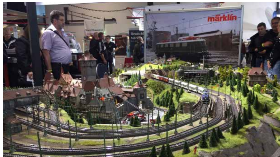
Mobile Schauanlagen zeigen Aussteller in und um die Werfthalle im Stauferpark.

die große Schauanlage besichtigen, die von Modellbahn-Enthusiasten detailverliebt auf über 100 Quadratmetern gestaltet wurde. Allein über 150 Weichen und zwei Drehscheiben wurden dort verbaut. Das neue Märklinmuseum zeigt auf 3000 Quadratmetern die Geschichte des Unternehmens und seiner Produkte, wobei der Modelleisenbahnbau einen Schwerpunkt einnimmt. 15 Mil-