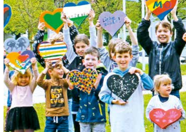
Mit selbst bemalten Holzherzen zeigen die Kinder ihre Liebe zum Ostalbkreis.

Alle Sechs- bis Zwölfjährigen dürfen sich auf einen Malwettbewerb freuen. Gefragt ist der Lieblingsort im Ostalbkreis. Eine Malvorlage für den Wettbewerb gibt es in der Veranstaltungsbroschüre ( www.ostalbkreis.de ).