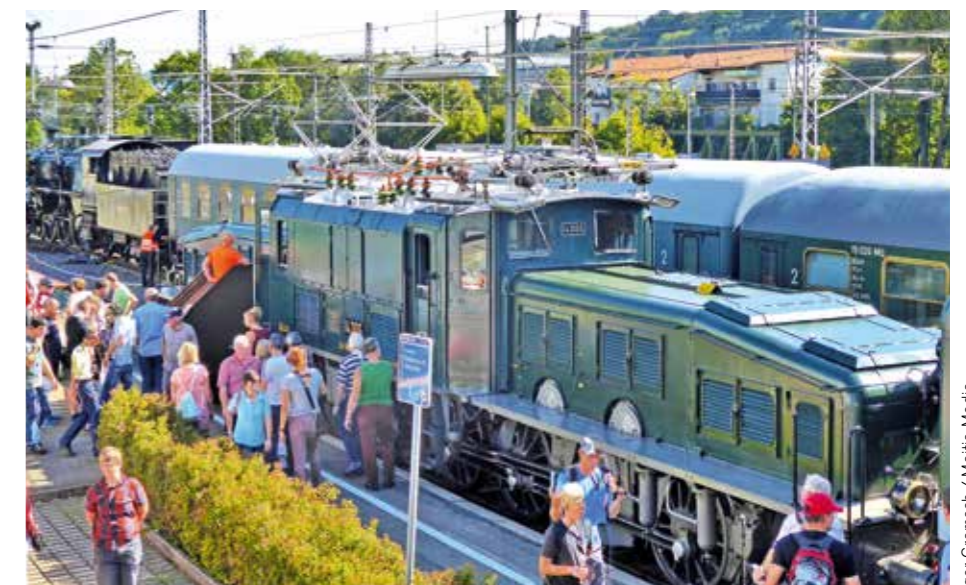
Historische Dampflokomotiven (oben rechts) sind im Göppinger Bahnhof zu sehen, wo 2019 auch das legendäre »Krokoldil« (Bild unten) besichtigt werden konnte. In der EWS-Arena werden Gartenbahnen gezeigt (oben links).

Veranstaltungsorte: Werfthalle Stauferpark, EWS-Arena, Märklineum/Stammwerk, Bahnhof Göppingen, Areal Leonhard Weiss. Ganztägiger Buspendelverkehr www.maerklin.de