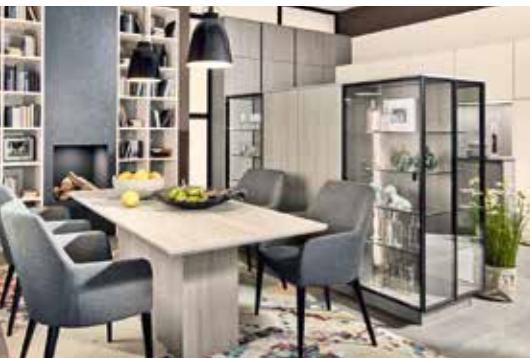
Glasvitrinen sorgen für einen gelungenen Übergang zum Ess- und Wohnbereich.

Mit der Küche ist noch nicht Schluss. Die Produzenten richten auch Ess- und Wohnzimmer, Flure, Hauswirtschaftsräume und Badezimmer ein und bieten raumübergreifende Konzepte an.