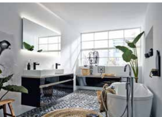
Schwarze Möbel verleihen dem Bad einen coolen Look.

Ihr Blick geht längst über die Küche hinaus: Die deutschen Küchenanbieter richten auch Ess- und Wohnzimmer, Flure, Hauswirtschaftsräume und Bäder auf individuelle und innovative Weise ein. Mit Hilfe raumübergreifender Konzepte lässt sich die offene Küche optisch besonders ansprechend mit dem Ess- und Wohnzimmer verbinden. Auch für Bäder, Flure und Hauswirtschaftsräume haben die Küchenmöbelproduzenten intelligente Lösungen für eine optimale Raumnutzung entwickelt