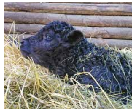
Die Kälber wachsen bei ihrer Mutter auf und sind Teil der Herde.

Die friedfertigen und genügsamen Gallowayrinder sind von Natur aus hornlos. Zwei Deckbullen sorgen bei den mittlerweile etwa 75 Rindern in zwei Mutterkuhherden zuverlässig für Nachwuchs. »Die Kühe kalben in der Regel problemlos alleine und die Kälber dürfen dann zehn Monate